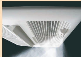
天井カセットタイプ

毎日のお風呂で、キレイに、健康に、ゆったりと。ミストサウナでわが家のお風呂を素敵な空間に変えられます。始めませんか、ミストのある暮らし。健康やエステ志向の高まりとともに、入浴時に楽しめるサウナが注目されています。いつもツツツヤの美肌でいたい。カラダもココロも健康でいたい。女性なら誰もが願う夢を、わが家のお風呂でミストサウナを楽しめば、そんな夢もグッと近づいてきます。